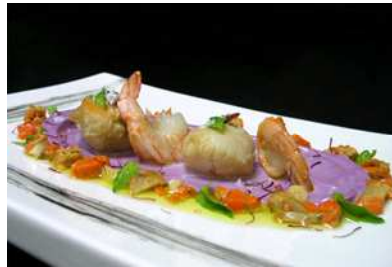
Safran, terre et mer