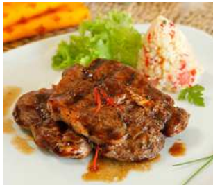
Loin mariné au safran