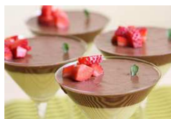
Mousse au chocolat et le safran