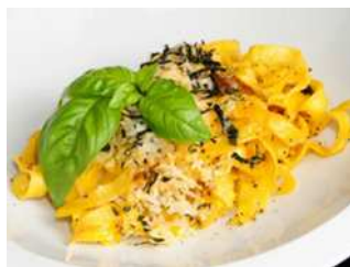
Pâtes aux safran avec graines de pavot